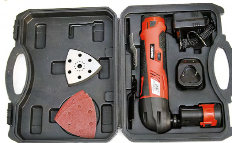
▲ Комплект поставки (1 или 2 аккумулятора в комплекте)

У мультитула яркий и запоминающийся дизайн. Эргономика — отличная. Тактильная рукоятка с мягким покрытием обеспечивает максимальный комфорт и управляемость инструментом во время работы. Клавиша пуска удобно расположена в месте хвата. Так же удобно расположено и колесико регулирующее частоту осцилляций. Широкий диапазон возможных значений регулировки позволяет использовать инструмент для большего спектра задач.