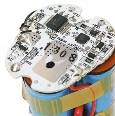
▲ Электроника аккумулятора

Подобные универсальные инструменты, на сегодняшний день, пожалуй, одни из самых востребованных на рынке, поскольку позволяют быстро, точно и очень удобно работать с разнообразными материалами. Часто для выполнения некоторых работ обычный электроинструмент просто не подходит. Мультитул от OMAX позволяет выполнять такие работы как: пиление, шлифование, шлифовка в углах и на стыках, извлечение стекол, шлифовка профилей, раскрой, резка, шпатель и полировка с самыми различными материалами. Это далеко не все примеры работ, при выполнении которых очень кстати придется новинка компании OMAX.